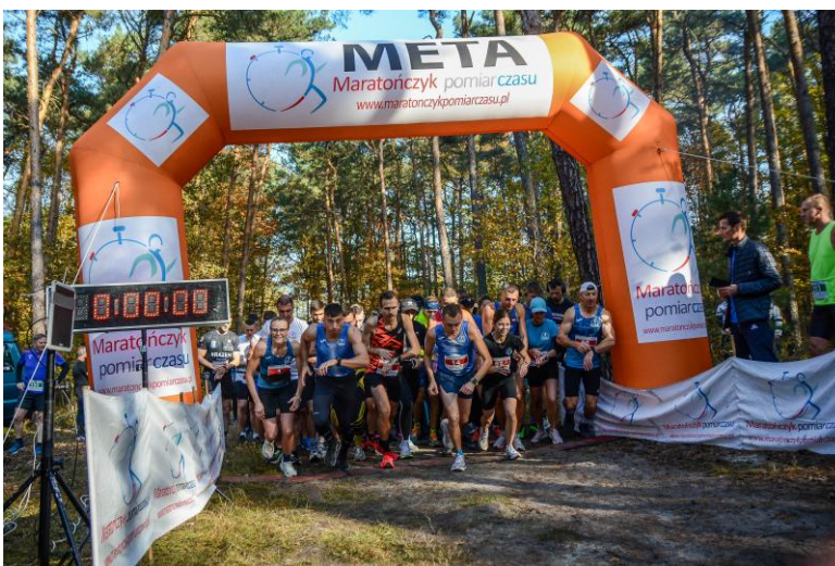
„Octoberforestrun Jarocin 2024”