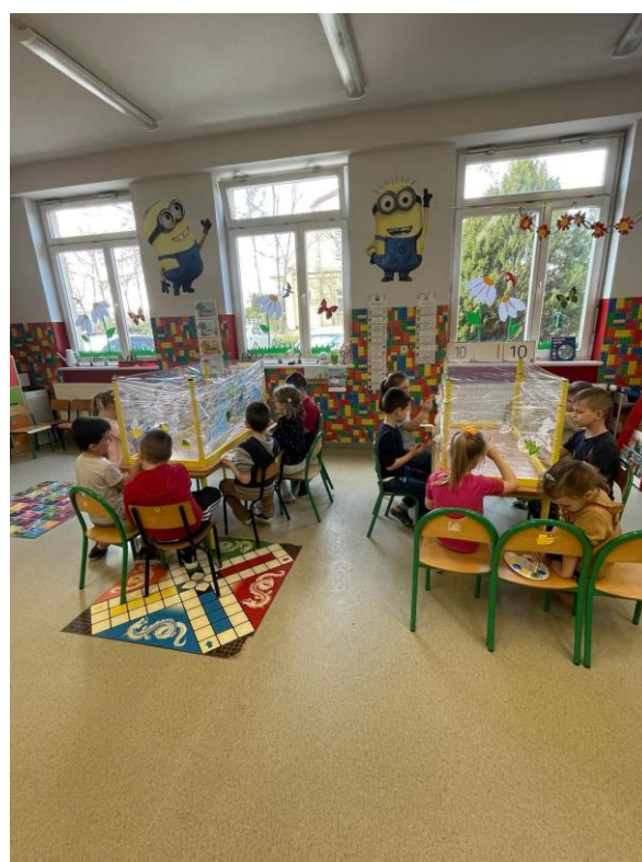
„Zajęcia pozalekcyjne dla dzieci i młodzieży”