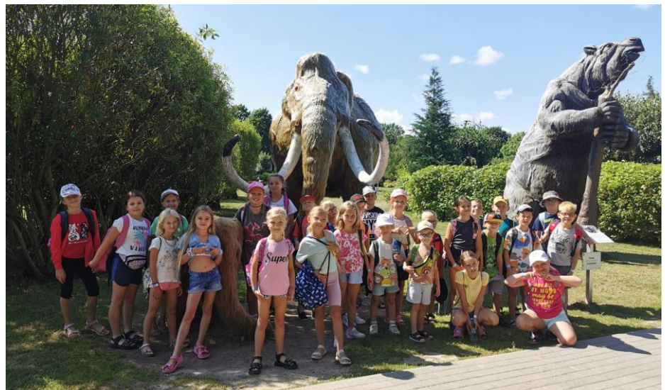
„Półkolonie z Piraniq”