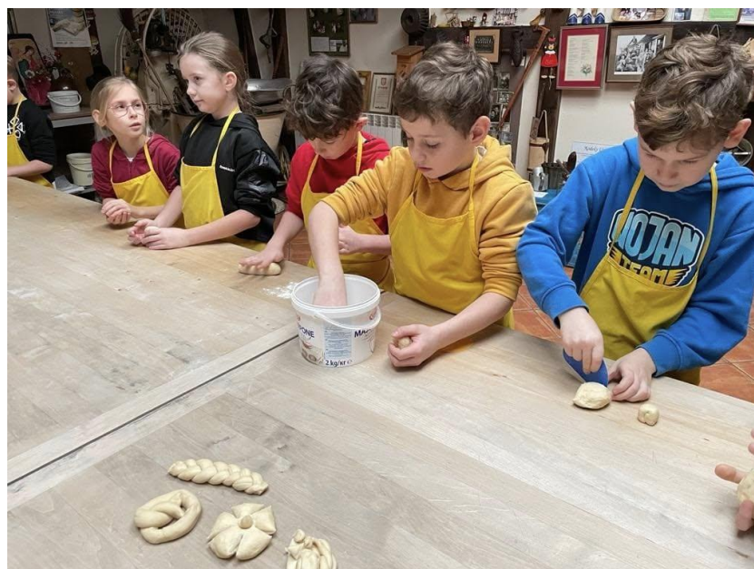
„Organizacja półkolonii zimowych dla uczniów Niepublicznej Szkoły Podstawowej z oddziałem przedszkolnym w Roszkowie”