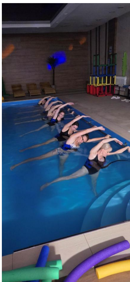
„Aqua Fit & Life”