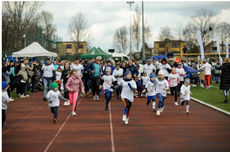
„Jarocin dla Każdego - Bieg kolorowej Skarpetki w Światowym Dniu Zespołu Downa”