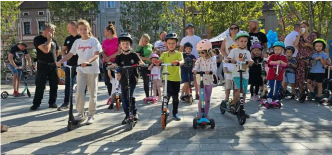
„Projekt pn. „Praktyczna historia roweru”