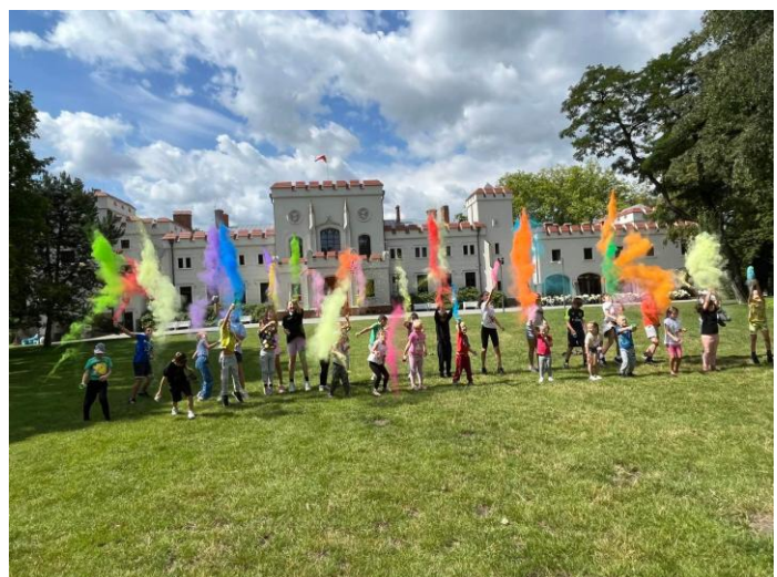
„Odlotowe półkolonie z Białymi Tygrysami dla dzieci i młodzieży z terenu gminy Jarocin”