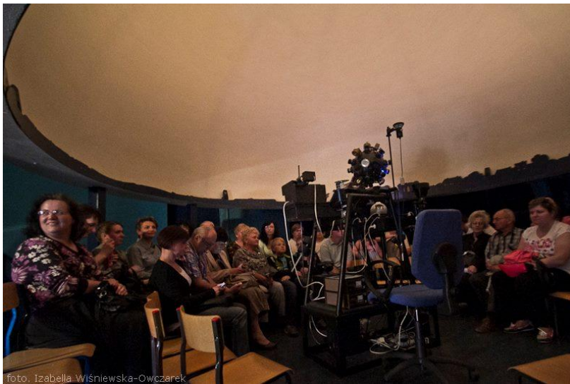
„Z astronomią na TY”