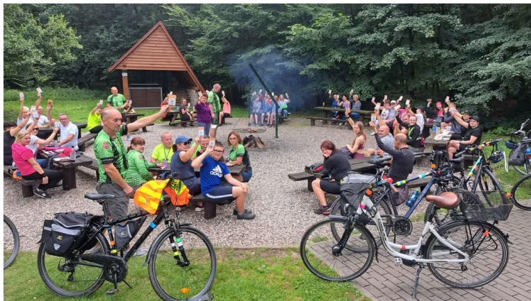
„Organizacja wydarzeń i rajdów rowerowych pod nazwą „RoweLOVY 2024”: