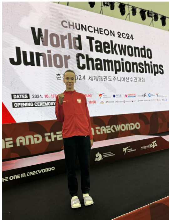
„Kierunek Jarocin - Korea 2024!”