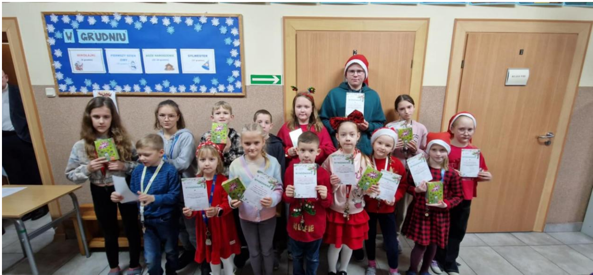
„Nasza wspólna sprawa to nauka i zabawa IV”