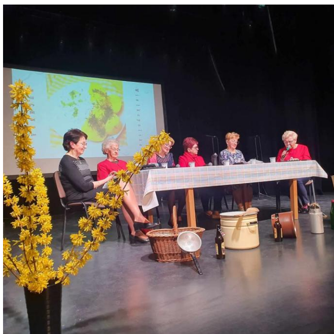
„Pyry, skrzyczki - przepisy kulinarne w gwarze”