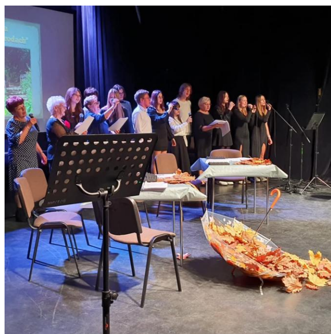
„Między słowami - Tuwim kontra Kofta”