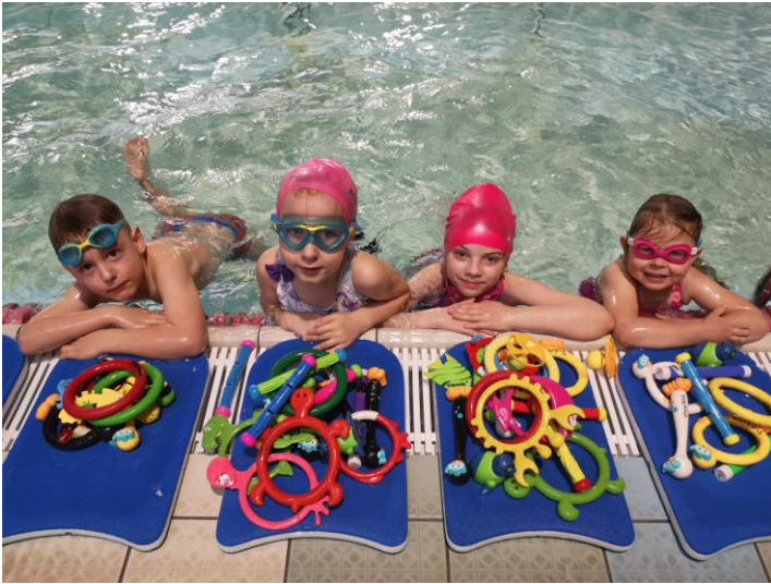
„Prowadzenie szkółki PIRANIA”