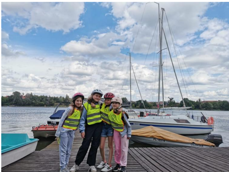
„Organizacja obozu sportowo- rekreacyjnego w Wągrowcu”