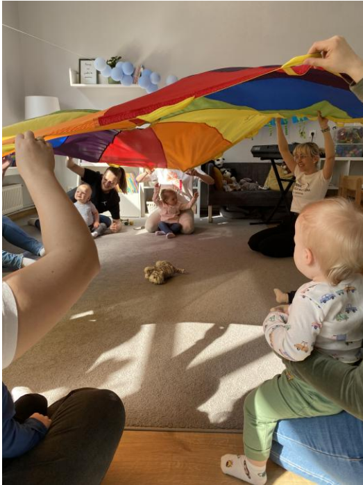
„Realizacja zajęć rozwojowych dla rodziców z dziećmi od urodzenia do 7 r.ż. w zakresie wspierania rodziny”