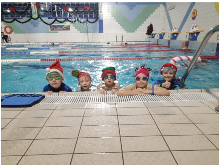
„Trening pływacki dla dzieci do 10 lat w 2024 r.”