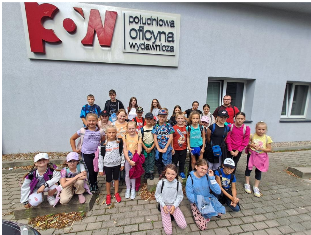
„Poznajmy się – tropem zawodów”