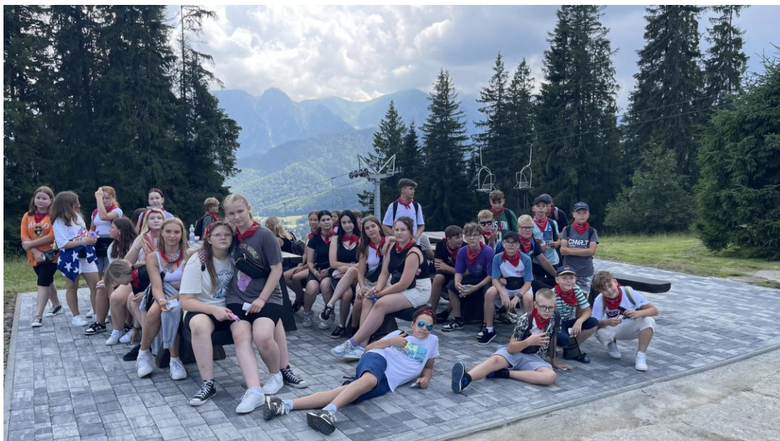
"Dawaj w góry!"