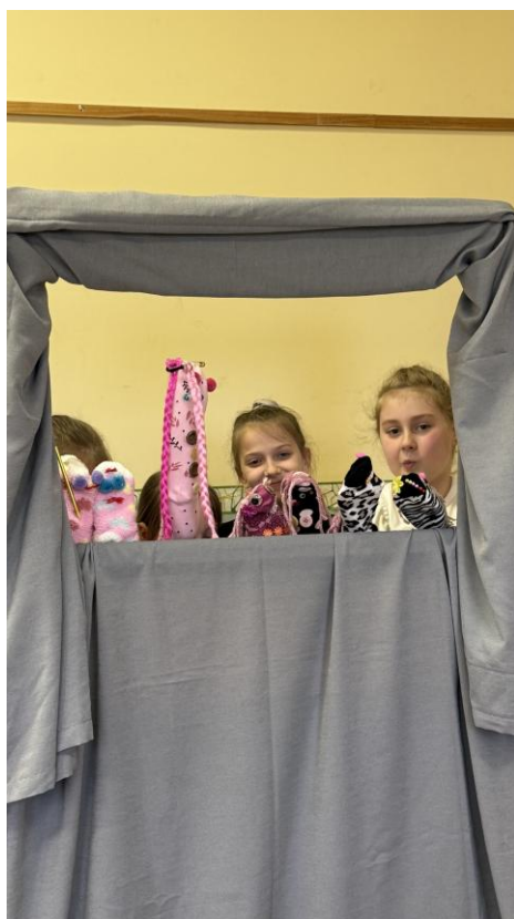
„Świetlica dobra sprawa- jest nauka i zabawa”