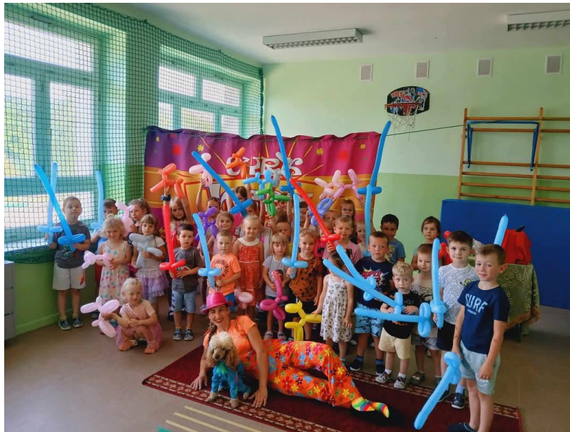
„Półkolonie letnie dla dzieci uczęszczających do Niepublicznej Szkoły Podstawowej z oddziałem przedszkolnym w Roszkowie”