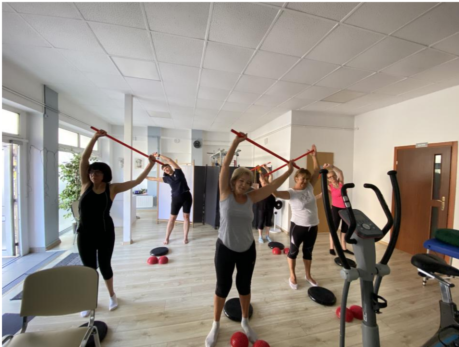
„Świadczenie usług specjalistycznych w lokalnej społeczności w zakresie usług opiekuńczych i uzupełniających dla osób z potrzebą wsparcia w codziennym funkcjonowaniu”