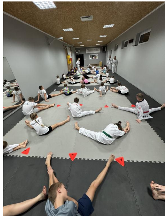
„Prowadzenie szkółek sportowych w taekwondo olimpijskim dla dzieci i młodzieży z terenu gminy Jarocin z programem profilaktycznym „Zapobieganie lepsze od leczenia”