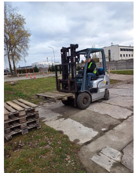
„Operator wózka widłowego”