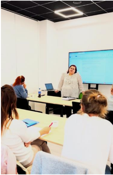
„Kadry i płace”

„Realizacja szkoleń branżowych/specjalistycznych dla mieszkańców Gminy Jarocin”