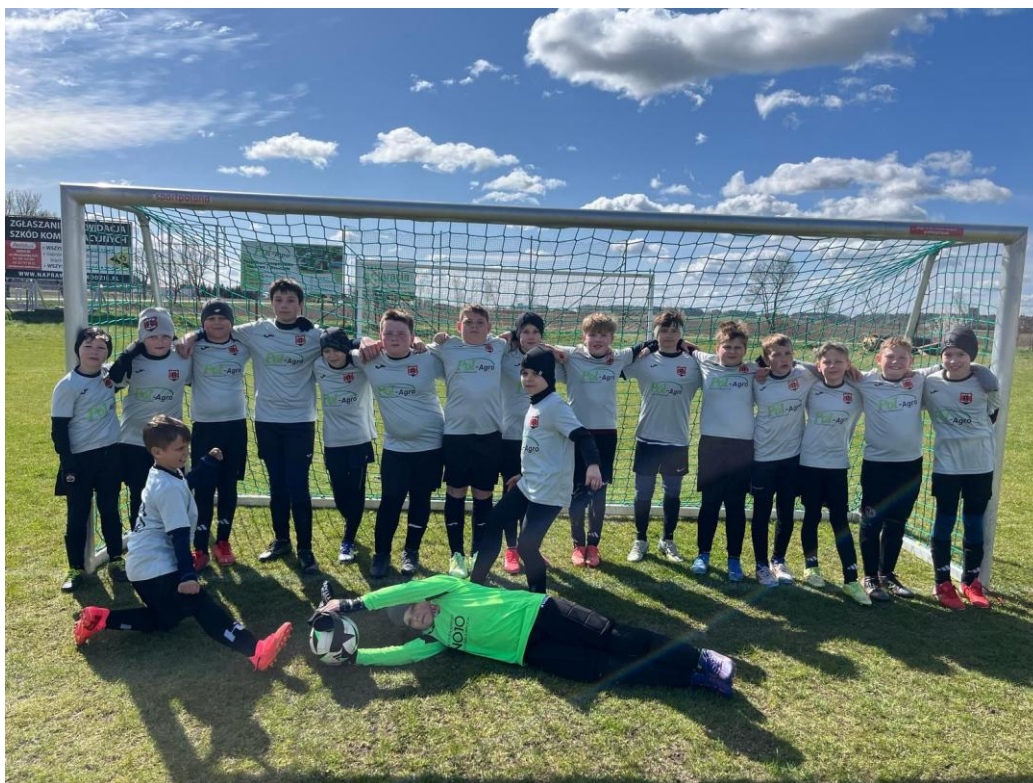
„Szkolenie piłkarsko uzdolnionej młodzieży przez LZS Grom Golina w roku 2024”