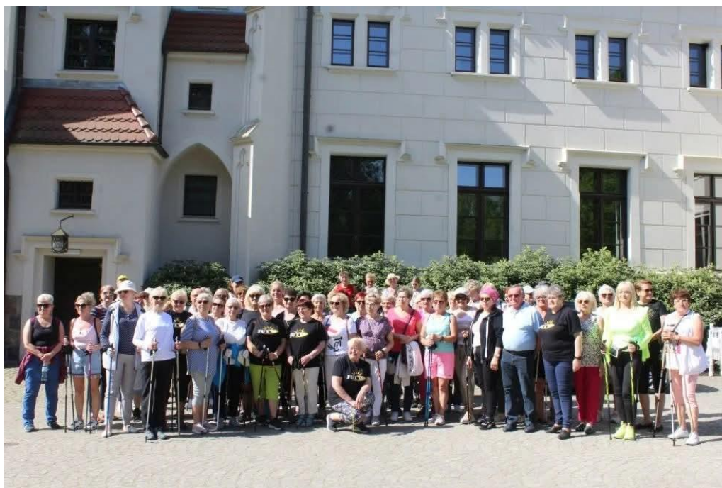
„Pieszno i rowerem po Ziemi Jarocińskiej - edycja 2024”