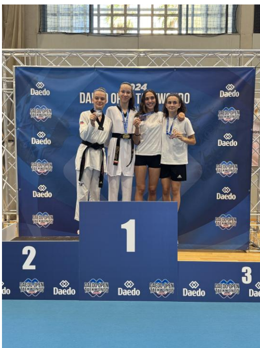
„Jarocińska Akademia Taekwondo Olimpijskiego - szkolenie sportowe oraz udział we współzawodnictwie sportowym dzieci i młodzieży”