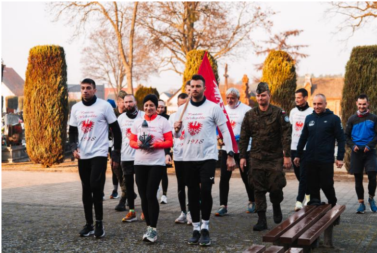
„Bieg poświęcony Powstańcom Wielkopolskim Jarocin 2024 wraz z upamiętnieniem 150-lecia powstania kolei w Jarocinie”