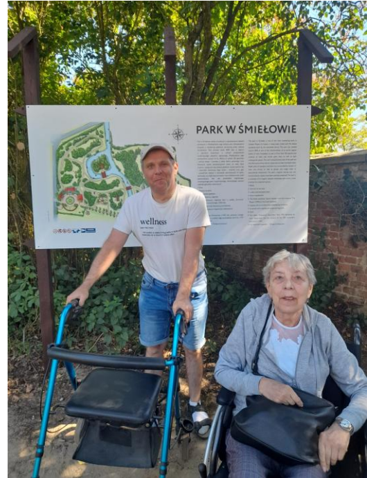
„Asystent Osobisty Osoby Niepełnosprawnej – edycja 2024”