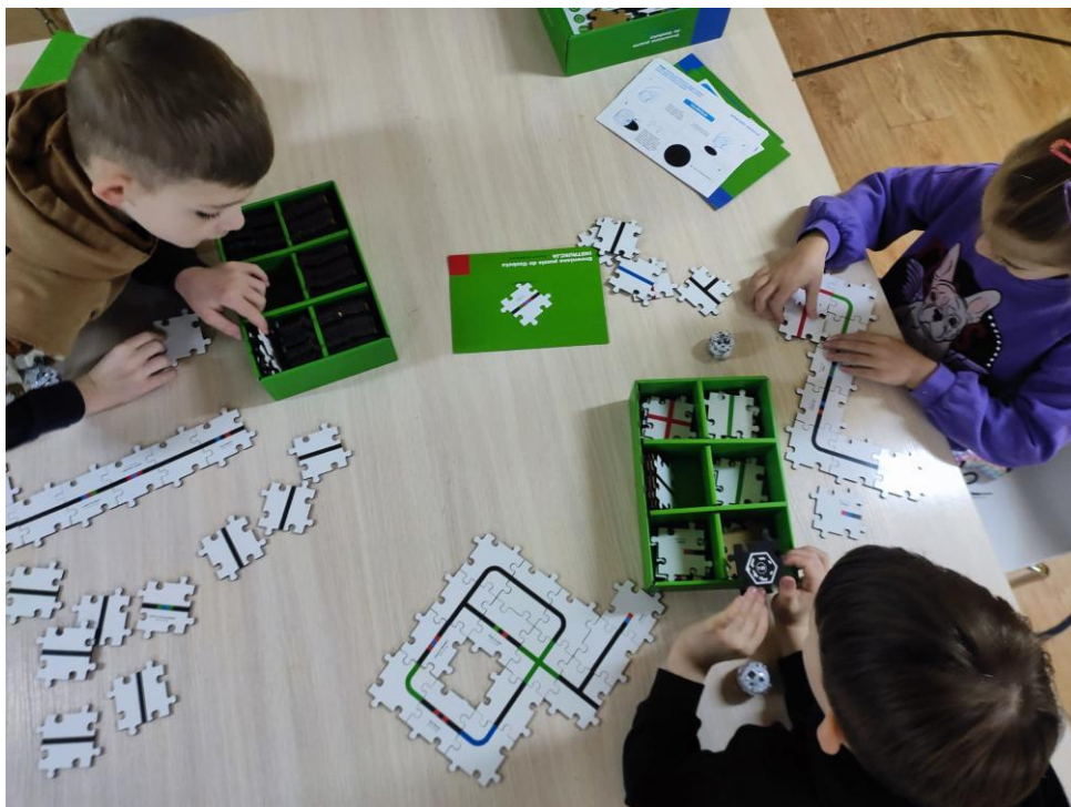
„Świetlica socjoterapeutyczna Sigma dla młodzieży 10-15 lat”